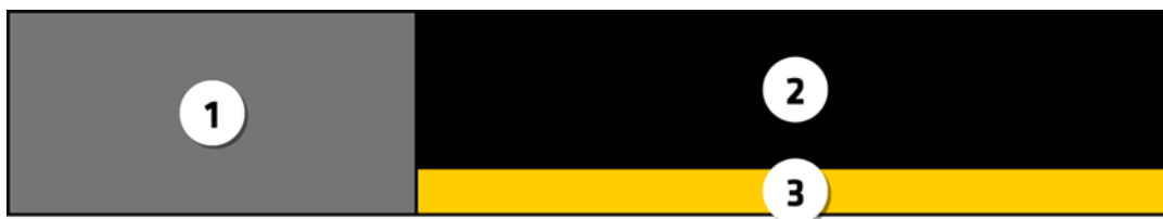
Bild 3. Foto 1, varningstext 2 och avvänjningsinformation 3 placeras bredvid varandra i extra brett format

Om höjden på den kombinerade hälsovarningen är högst 20 % av dess bredd på grund av styckförpackningens eller ytterförpackningens form ska ett extra brett format användas där beståndsdelarna i den kombinerade hälsovarningen placeras bredvid varandra enligt illustrationen. Fotot ska täcka 35 %, varningstexten 50 % och rökavvänjningsinformationen 15 % av den kombinerade hälsovarningens yta inom den yttre svarta ramen.