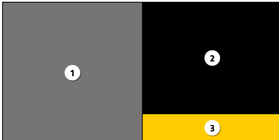
Bild 2. Foto 1, varningstext 2 och avvänjningsinformation placeras bredvid varandra

Om ett format används där beståndsdelarna placeras bredvid varandra ska fotot placeras på den vänstra halvan av den kombinerade hälsovarningen, med varningstexten ovan till höger och rökavvänjningsinformationen nedan till höger på hälsovarningen. Fotot ska täcka 50 %, varningstexten 40 % och rökavvänjningsinformationen 10 % av den kombinerade hälsovarningens yta inom den yttre svarta ramen.