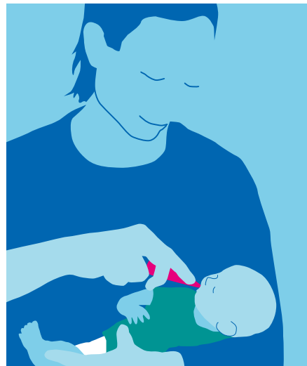
این واکسین به شکل قطره در دهان تطبیق میشود و مزه شیرین دارد.

بدون واکسین، تقریباً همه اطفال قبل از تکمیل سن پنج سالگی حد اقل یکبار به عفونت ویروس روتا مبتلا میشوند.