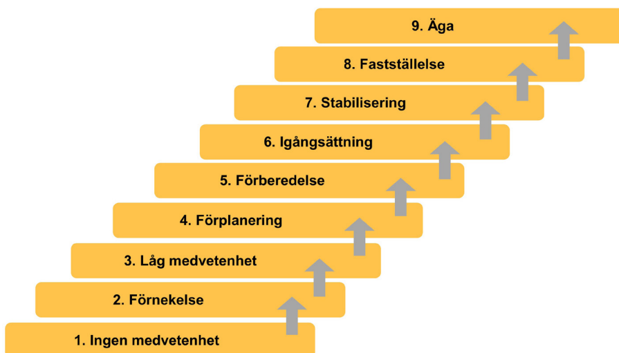
Figur 2. Förändringsberedskap "Community Readiness Model. Hämtad från: Oeting m.fl. (1995).

tillitsfulla relationer, trygghet, trivsel, inkludering och skolframgång. Men dels också de mer tobaksspecifika skyddsfaktorerna som att begränsa tillgången till tobak under skoltid, reagera vid tobaksbruk och att vara goda vuxna förebilder. Därtill ingår också att uttala förväntningar, stärka tobaksfrihet som norm och att föra dialog och samverka med elevernas föräldrar kring tobaksfrågan.