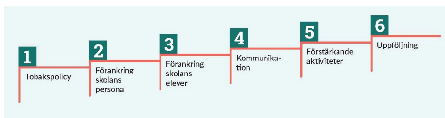
Figur 3. Processmodellen för Tobaksfri skoltid NU.

Steg 6 sker både en uppföljning av det genomförda arbetet och en förstärkning av det fortsatta arbetet.