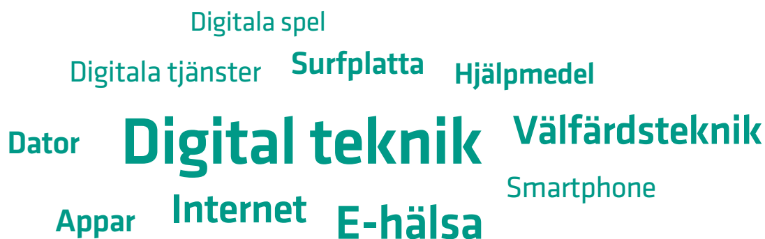
Figur 3. Exempel på begrepp och användningsområden.

Mer information på Fortes webbplats: www.forte.se