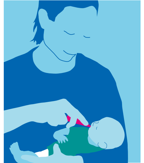
يعطى اللقاح كقطرات في الفم وله مذاق حلو.

بدون التطعيم يصاب جميع الأطفال تقريباً بعدوى فيروس روتا واحد على الأقل قبل بلوغهم سن الخامسة من عمرهم.