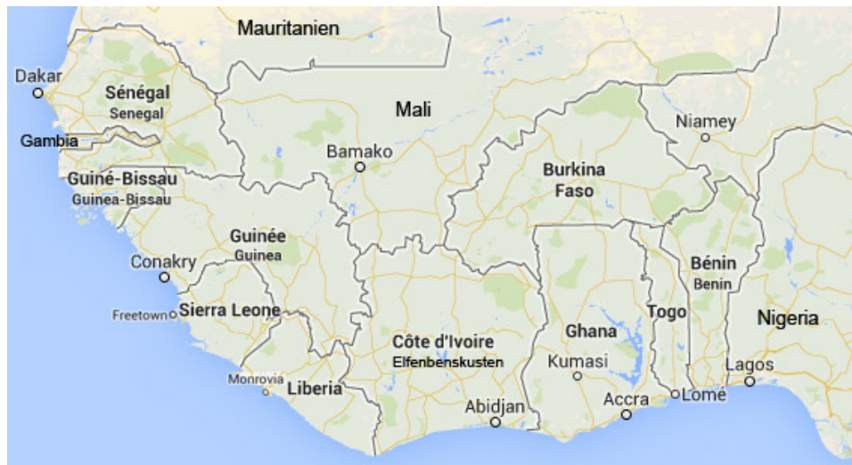
Figur 1. Karta över Västafrika